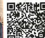
掃描了解更多救助兒童故事